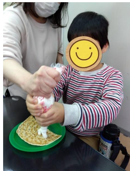
クレープ作りの様子です！

日頃から、保護者の皆様にはご理解、ご協力を頂きありがとうございます。 そろそろ新年度がスタートします。4月からも色々な経験を重ねて楽しく過ごしていきたいと思います！ 今月も様々なイベントを企画しましたのでご参加お待ちしております！