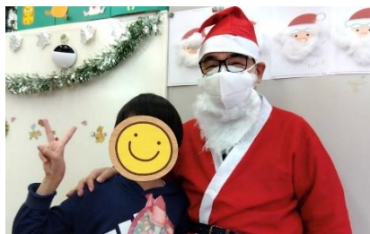
クリスマス会では ケーキを作りました♪

★ご予約の変更はTEL・FAXもしくはLINEで！★ TEL・FAX 048-789-7177(岸町事業所) 携 帯 070-3252-1112(えがお岸町) 吉 田 080-3479-9087