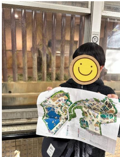
遠足で 上野動物園に行きました！

日頃から、保護者の皆様にはご理解、ご協力を頂きありがとうございます。今年度も残りわずかとなりました。この一年を振り返り、一人ひとり自分のペースで大きくたくましく成長した姿に、うれしさを感じているこの頃です。今月も様々なイベントを企画しましたのでご参加お待ちしております！